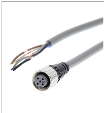
Round Water-resistant Connectors (M12 Threads)