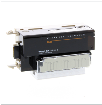
リモートI/Oターミナル XWT-ID16