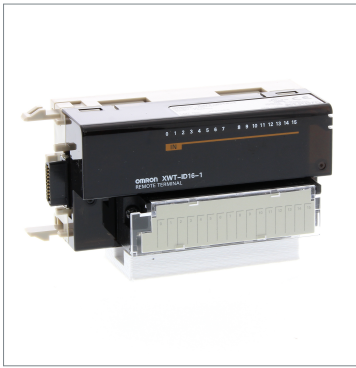
Remote I/O Terminal XWT-ID16