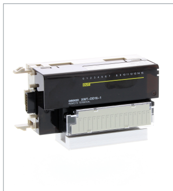
Remote I/O Terminal XWT-OD16