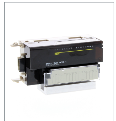
Remote I/O Terminal XWT-OD16-1