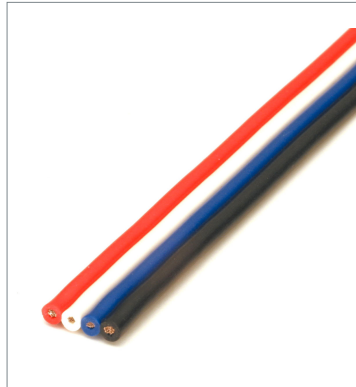
Flat cable DCA-4F10