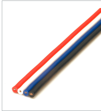
フラットケーブル DCA4-4F10