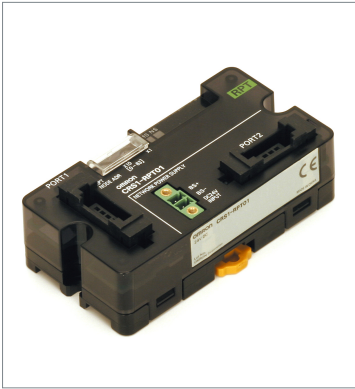
CompoNet リピータユニット CRS1-RPT01