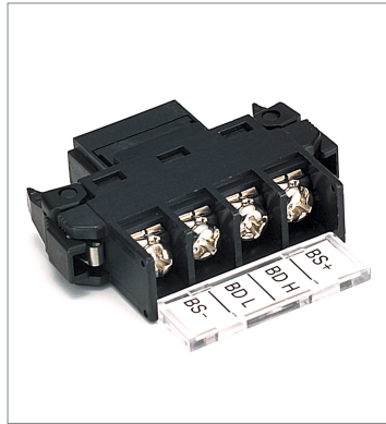
オープン型コネクタ DCN4-TB4