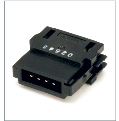
フラットコネクタ (プラグ) DCN4-BR4