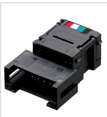
フラットコネクタ (ソケット) DCN4-TR4