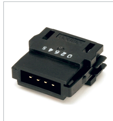
Flat Connector (Plug) DCN4-BR4