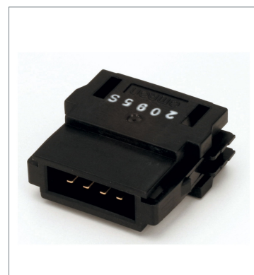
Termination resistor DCN4-TM4