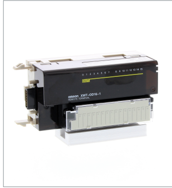
Remote I/O Terminal XWT-OD16