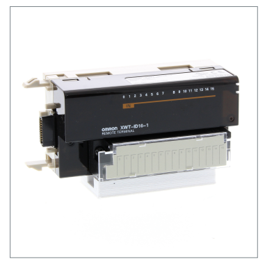
Remote I/O Terminal XWT-ID16