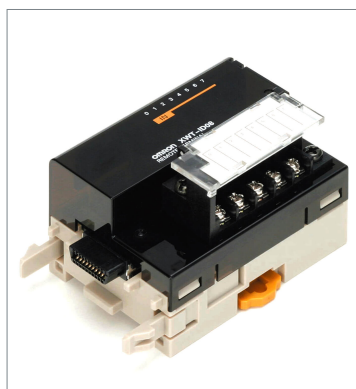
Remote I/O Terminal XWT-ID08