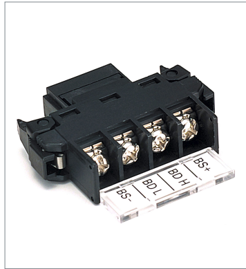
Open Type Connector DCN4-TB4