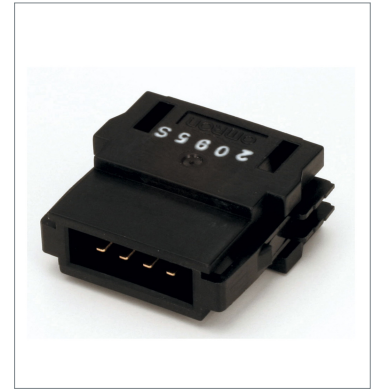
Termination resistor DCN4-TM4