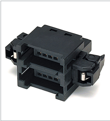
Multidrop Connector DCN4-MD4