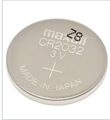
Mounted in an CP2E-N/CP2E-S-type CPU Unit CP2W-BAT02