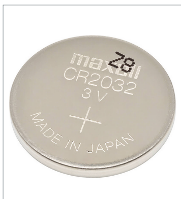
CP2E-N/CP2E-Sタイプ CPUユニット専用バッテリー CP2W-BAT02