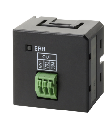
アナログ出力オプションボード CP1W-DAB21V