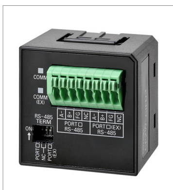
RS-485 & RS-485 オプションボード CP2W-CIFD3