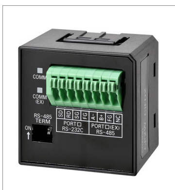
RS-232C & RS-485 オプションボード CP2W-CIFD2