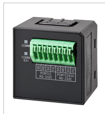
RS-232C & RS-232C オプションボード CP2W-CIFD1