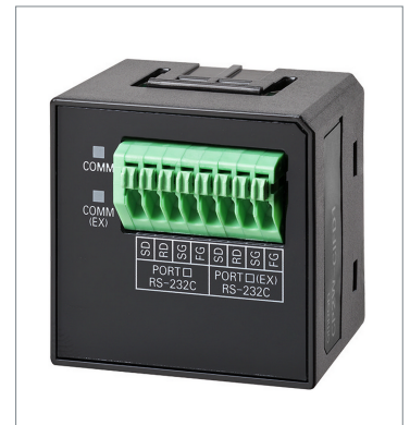
RS-232C&RS-232C Option Board CP2W-CIFD1