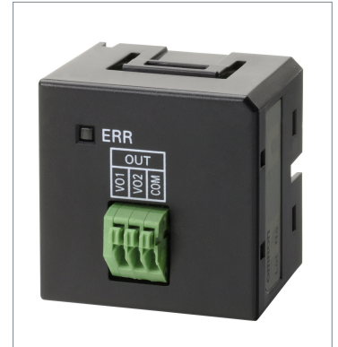
Analog Output Optional Boards CP1W-DAB21V