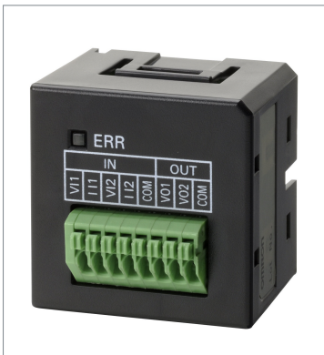
Analog I/O Option Board CP1W-MAB221