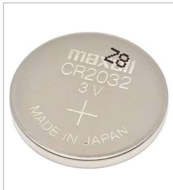
Mounted in an CP2E-N/CP2E-S-type CPU Unit CP2W-BAT02