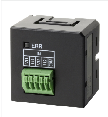
Analog Input Option Board CP1W-ADB21