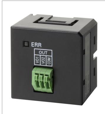
Analog Output Optional Boards CP1W-DAB21V