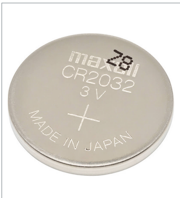
Mounted in an CP2E-N/CP2E-S-type CPU Unit CP2W-BAT02