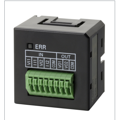
Analog I/O Option Board CP1W-MAB221