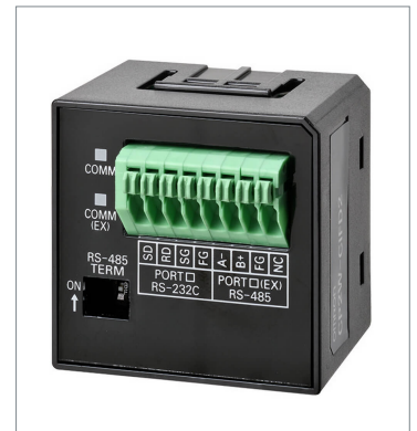
RS-232C&RS-485 Option Board CP2W-CIFD2