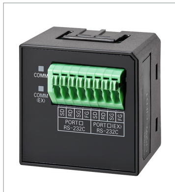
RS-232C&RS-232C Option Board CP2W-CIFD1