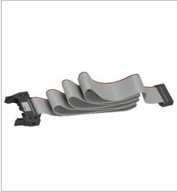
I/O Connecting Cables CP1W-CN811