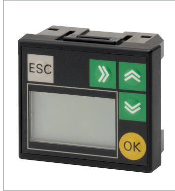
LCD Option Board CP1W-DAM01