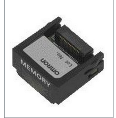
Memory Cassette CP1W-ME05M