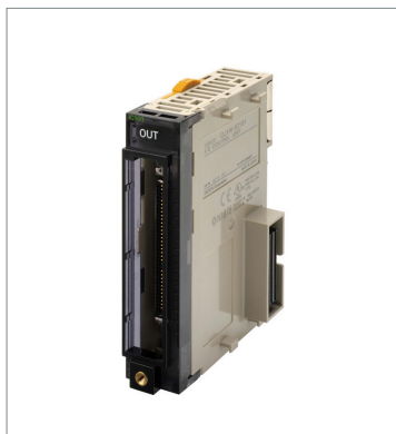
CJ1 I/Oコントロールユニット CJ1W-IC101