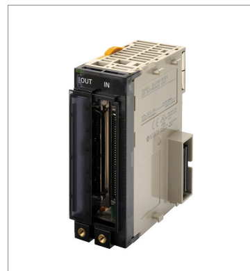
CJ1 I/Oインタフェースユニット CJ1W-II101