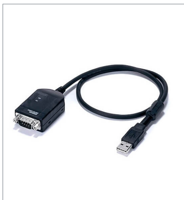
USB-シリアル変換ケーブル (D-subタイプ) CS1W-CIF31