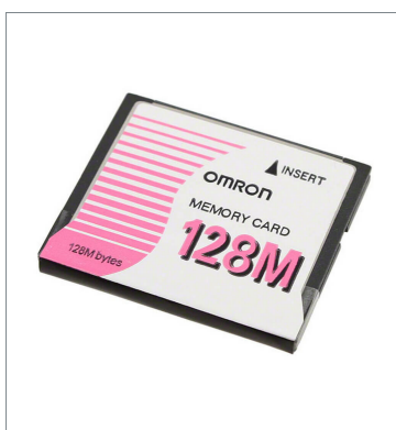
Memory Card HMC-EF183