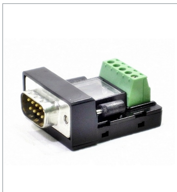
RS-422A Conversion Adapter CJ1W-CIF11