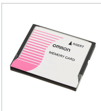
Memory Card HMC-EF283