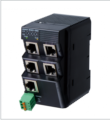
Industrial Switching Hub