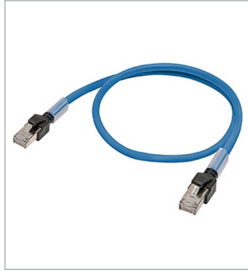
Industrial Ethernet Cables