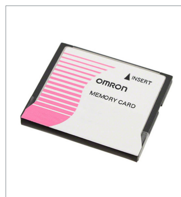
Memory Card HMC-EF583