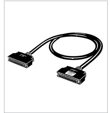
Connecting Cables for Expansion Backplanes CS1W-CN713