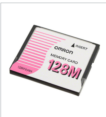
Memory Card HMC-EF183