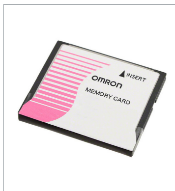
Memory Card HMC-EF283