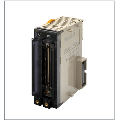
CJ1 I/O Interface Unit CJ1W-II101