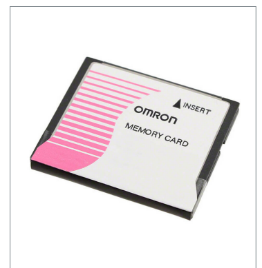
Memory Card HMC-EF583