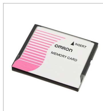
Memory Card HMC-EF583