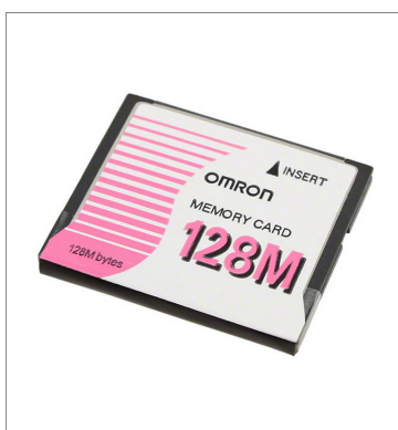
Memory Card HMC-EF183