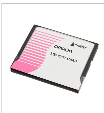
Memory Card HMC-EF283