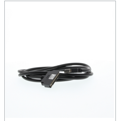
増設用I/O接続ケーブル CS1W-CN523