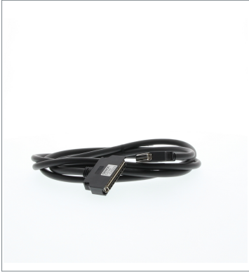
増設用I/O接続ケーブル CS1W-CN133