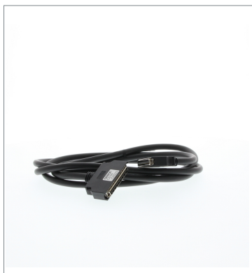
Connecting Cables for Expansion Backplanes