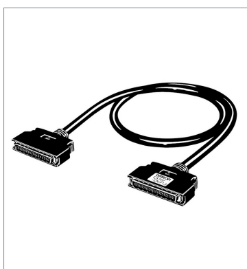
Connecting Cables for Expansion Backplanes