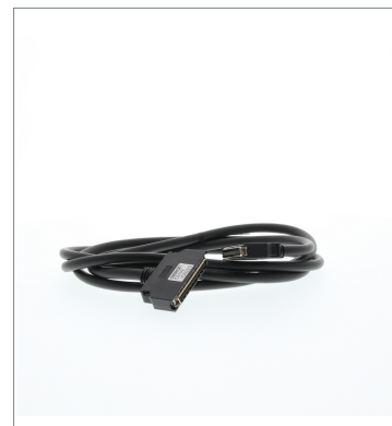
Connecting Cables for Expansion Backplanes