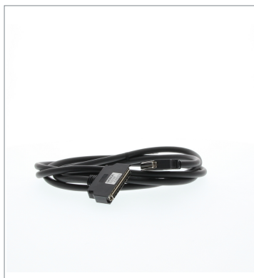
Connecting Cables for Expansion Backplanes