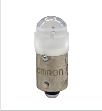
Pushbutton Switch (22 dia.) A22NZ-L-WA