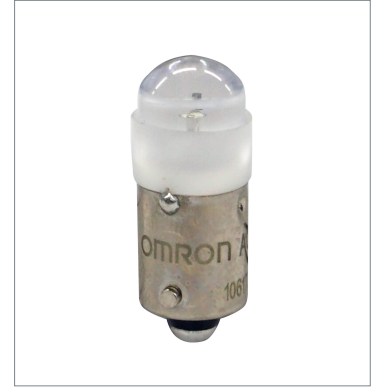
Pushbutton Switch (22 dia.) A22NZ-L-WC