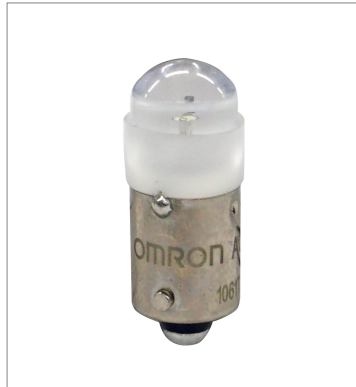
Pushbutton Switch (22 dia.) A22NZ-L-WE