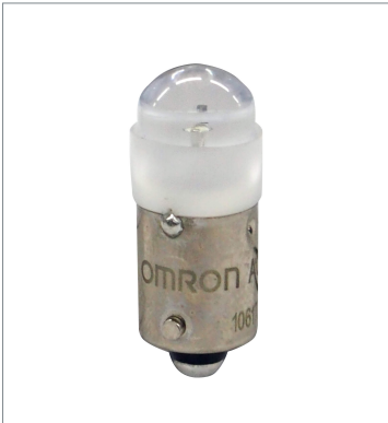
Pushbutton Switch (22 dia.) A22NZ-L-WD