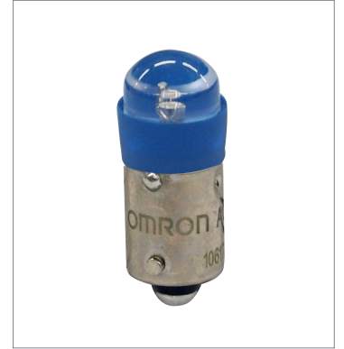
Pushbutton Switch (22 dia.) A22NZ-L-AE