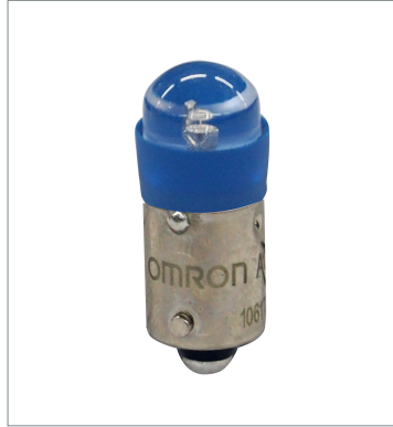
Pushbutton Switch (22 dia.) A22NZ-L-AD