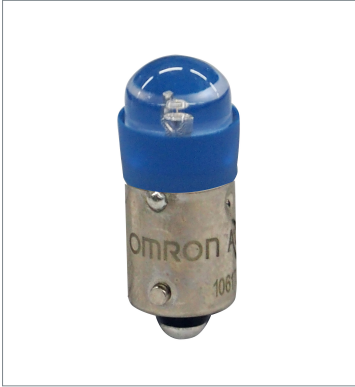
Pushbutton Switch (22 dia.) A22NZ-L-AC