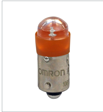
押ボタンスイッチ (φ22) A22NZ-L-OE