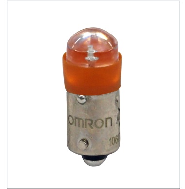
押ボタンスイッチ (φ22) A22NZ-L-OC