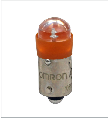
押ボタンスイッチ (φ22) A22NZ-L-OA