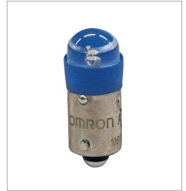
Pushbutton Switch (22 dia.) A22NZ-L-AE