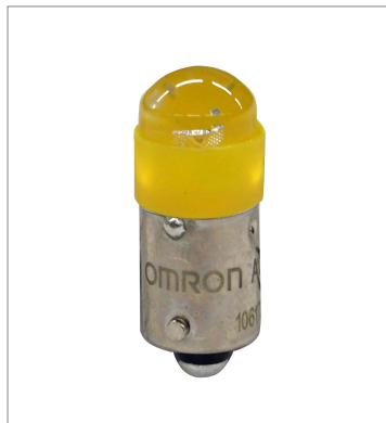
押ボタンスイッチ (φ22) A22NZ-L-YE