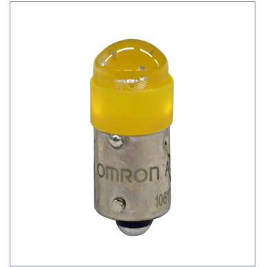
押ボタンスイッチ (φ22) A22NZ-L-YC