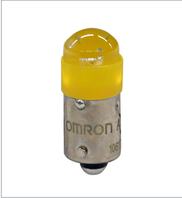
Pushbutton Switch (22 dia.) A22NZ-L-YA