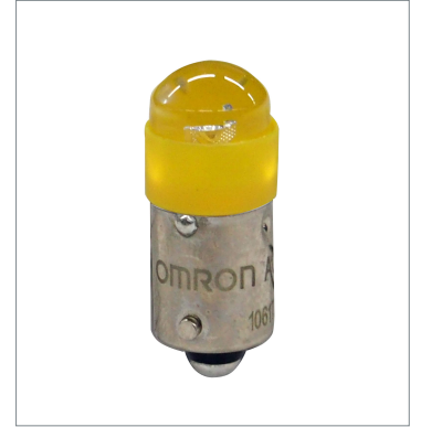
Pushbutton Switch (22 dia.) A22NZ-L-YC