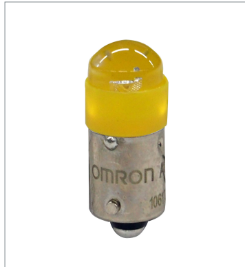
Pushbutton Switch (22 dia.) A22NZ-L-YE