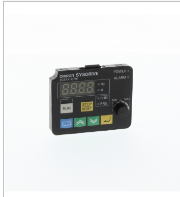
Digital Operator 3G3AX-OP01