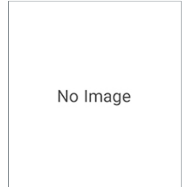
Connecting Cable for Digital Operator 3G3AX-OPCN3