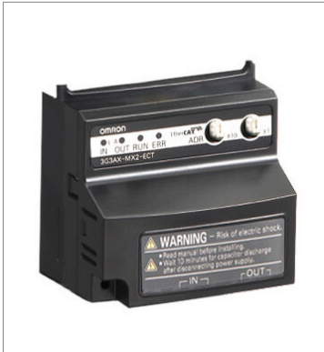
EtherCAT Communication Unit 3G3AX-MX2-ECT