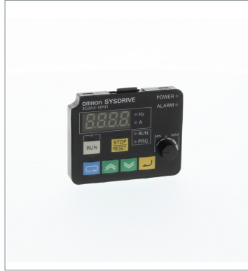
Digital Operator 3G3AX-OP01