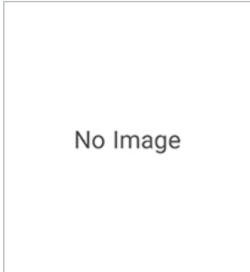
AC Reactor 3G3AX-AL2110