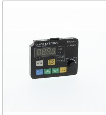
Digital Operator 3G3AX-OP01