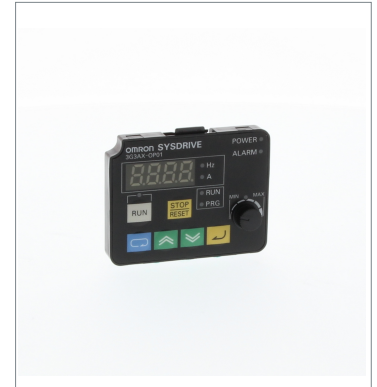
Digital Operator 3G3AX-OP01