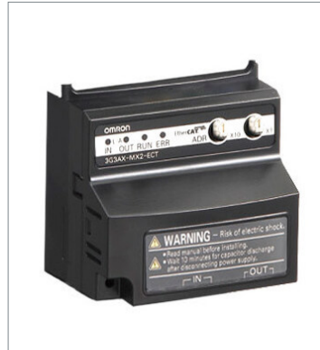
EtherCAT Communication Unit 3G3AX-MX2-ECT