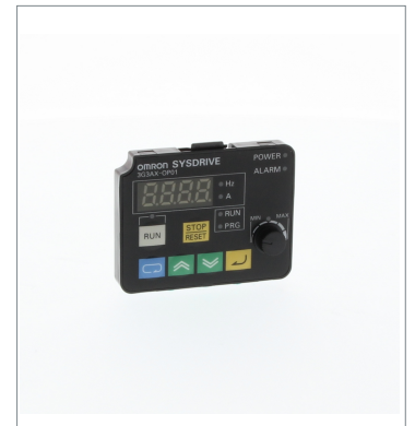
Digital Operator 3G3AX-OP01