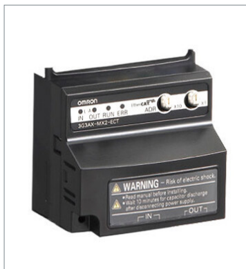
EtherCAT Communication Unit 3G3AX-MX2-ECT