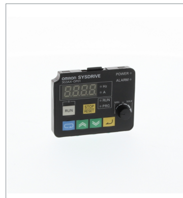
Digital Operator 3G3AX-OP01