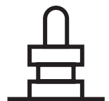
パネル取り付け 押しボタン形