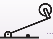
ヒンジ・ローラ レバー形