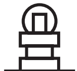
パネル取り付け ローラ・押しボタン形