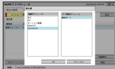
特定の機能モジュールのみ異常をモニタ可能