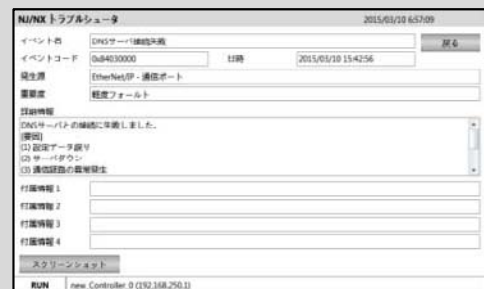
異常の詳細を確認