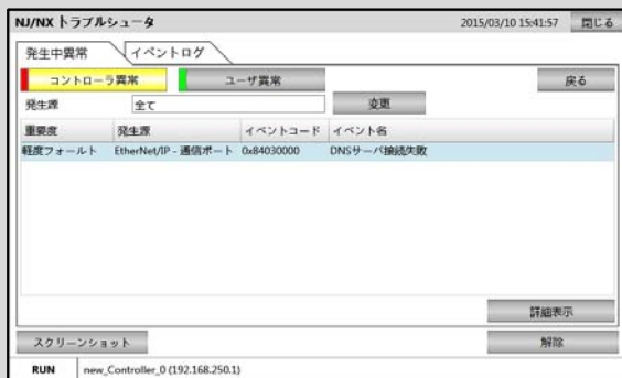
複数の機能モジュールの異常を同時にモニタ可能

NJ/NXコントローラ異常/コントローライベント/ユーザ異常/ユーザイベントを表示したり、解除することができます。さらにNAの画面をお客様が作成しなくても専用画面で確認が可能ですので、お客様の画面設計の手間をかけずにこの機能を利用する事ができます。