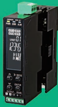
KM-N1-FLK本体と 端子台アダプタを 取り付けた状態