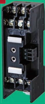
形KM-N1-FLK用 端子台アダプタ (形KM-N1OP-01)